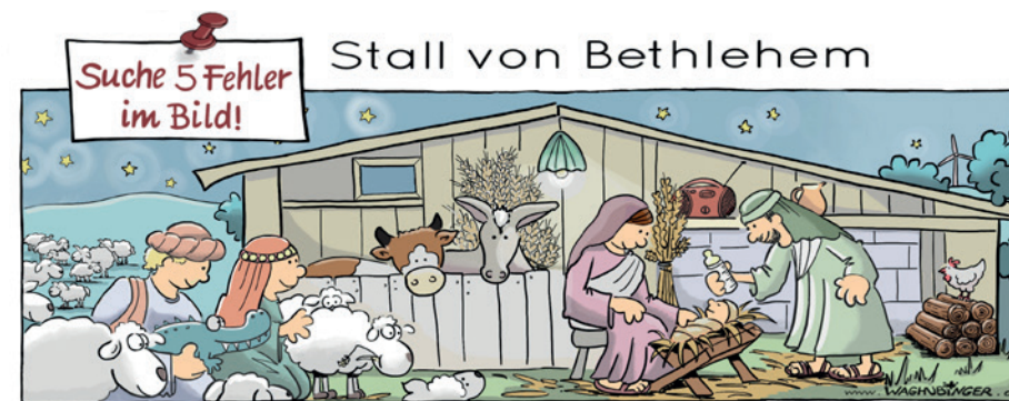
Krokodil, Lampe, CD-Player, Babyflasche, Windrod